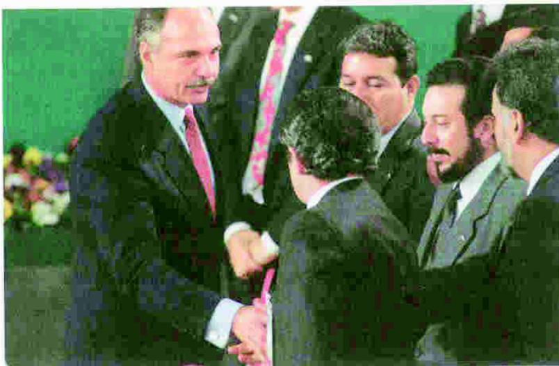
Los Acuerdos de Paz de El Salvador se firmaron en enero de 1992 en la ciudad de México. Un apretón de manos entre el presidente del país y el líder guerrillero del FMLN consolida el final del conflicto.