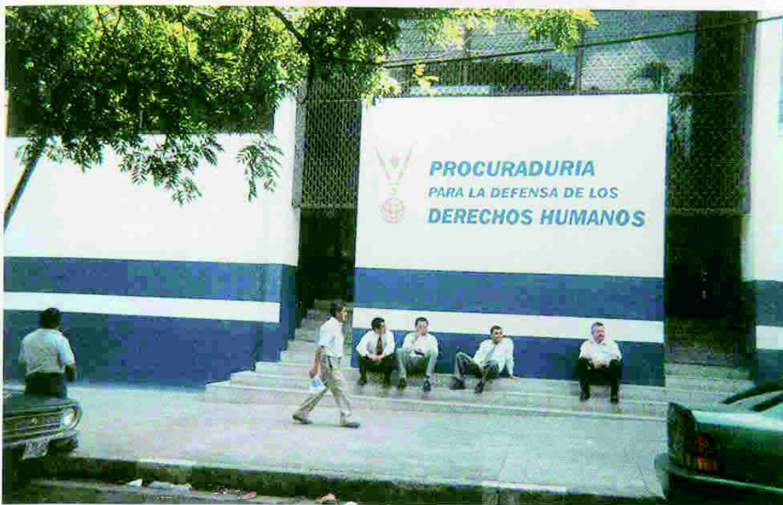
La Procuraduría para la Defensa de los Derechos Humanos es una de las instituciones creadas por los Acuerdos de Paz. Comenzó su actividad en 1992.

investigaciones, en un manejo serio de la información y que exigía cambios al Estado. Una evaluación señalaba eso como bondades de relevancia histórica.