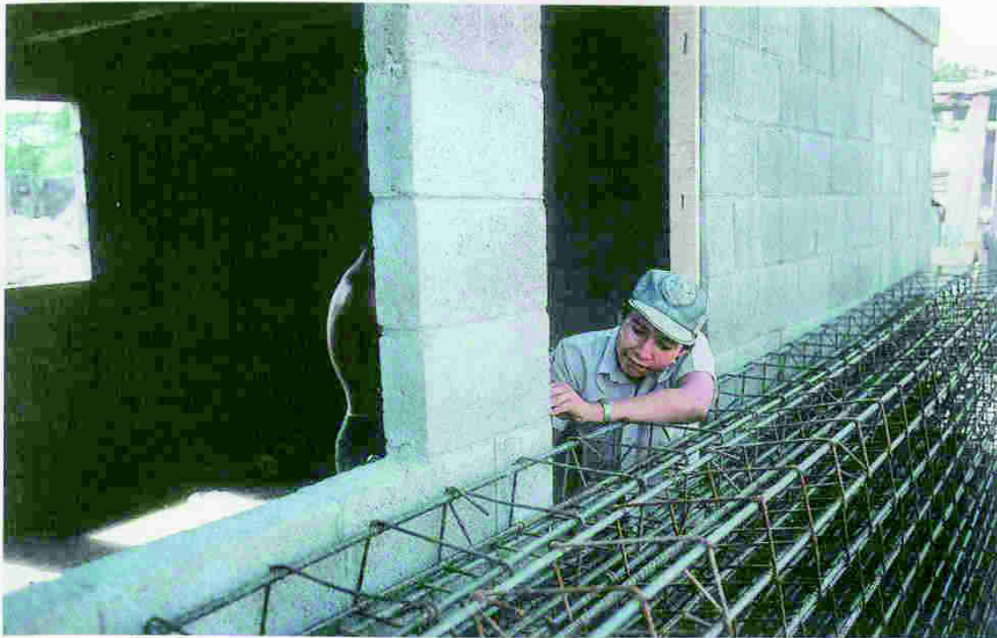
La organización FUSAI se dedica a la construcción de viviendas. A fines de los años 90, se convirtió en la mayor contraparte de Asdi.

de todo estamos bastante conformes», opina.