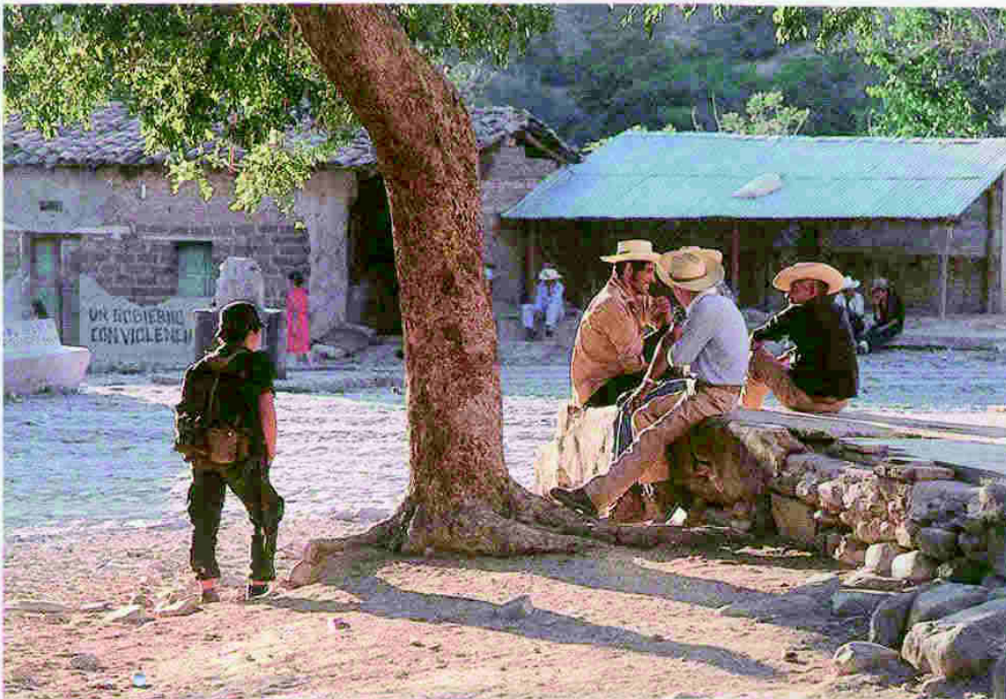
En la época del 80, la vida en San José de Las Flores cambió para siempre. Miles de familias campesinas fueron desplazadas, otras buscaron refugio fuera del país.

«La mayor parte de lo que se tiene es fruto del apoyo solidario.»