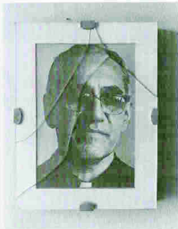
Monseñor Oscar Romero fue asesinado durante una misa en marzo de 1980.

La colaboración sueca con El Salvador tuvo desde el comienzo dos características: era humanitaria y, en alto grado, política.