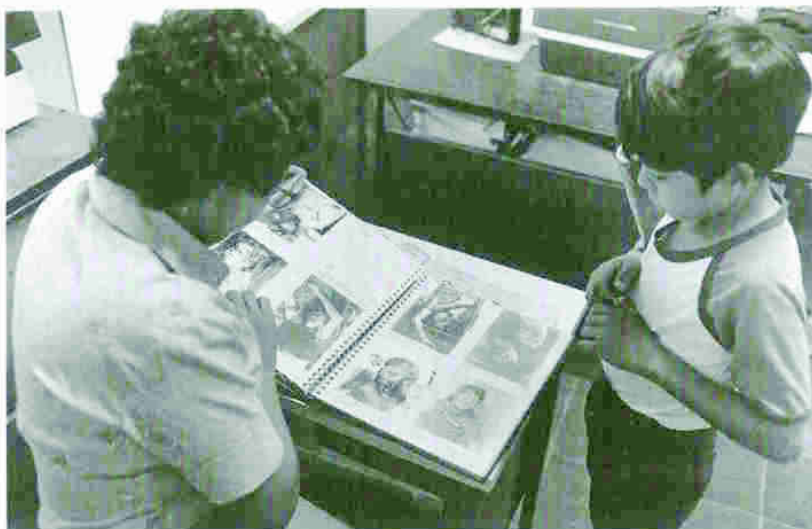
Una mujer busca la foto de su esposo desaparecido en el archivo de la Comisión para los Derechos Humanos, CDHES. La organización fue dependiente del apoyo sueco durante varios años.

Lindholm, que entonces trabajaba en la cancillería y ocupaba la secretaría del Comité.