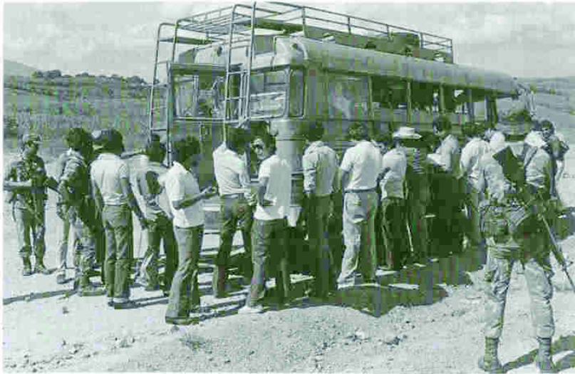
A principios de los 80, la represión creciente hacia la población civil en El Salvador motivó que los aportes para este país fueran los dominantes en la ayuda humanitaria sueca para América Latina. Aquí un control militar en la carretera Panamericana en San Vicente.