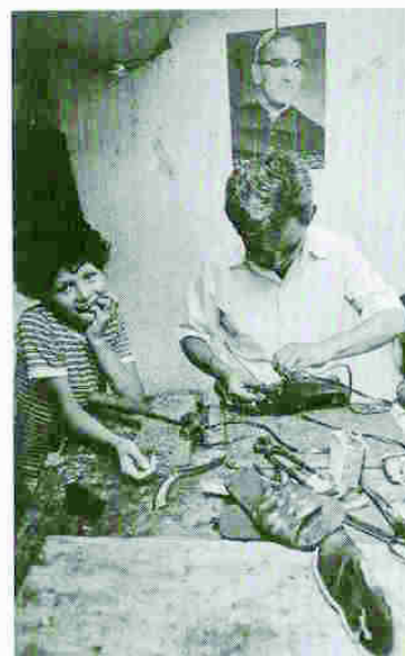
En la iglesia San Roque en San Salvador, se trabajaba para crear mejores condiciones de vida para las personas desplazadas; por ejemplo proporcionando capacitación profesional.

«Se sobresaltaron con nuestra posición y preguntaron cómo podían mantener la confianza ante su base si se sentaban a conversar con el gobierno. Les respondí: Cómo pueden ustedes mantener la confianza si ni siquiera lo intentan. Era algo importante y complicado lo que pedíamos; queríamos que los refugiados conversaran con aquellos que los habían obligado a huir.»